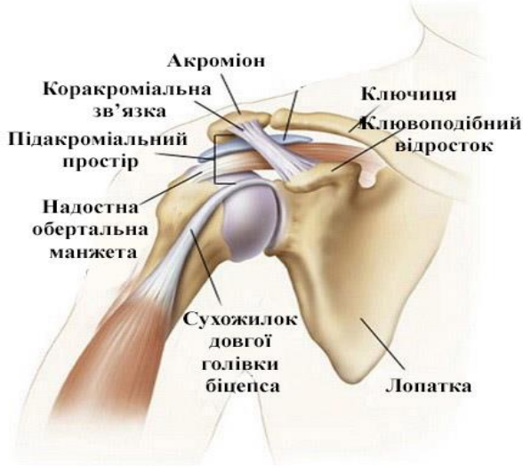
Рис. 1.1. Будова плечового суглобу