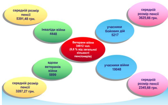
Рис.3. Структура ветеранів війни та середній розмір пенсій по Хмельницькій області

Отже для поліпшення пенсійного забезпечення для вказаної категорії громадян необхідно удосконалювати солідарну пенсійну систему.