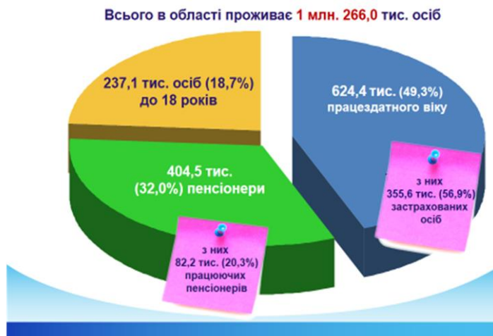
Рис. 1. Розподіл населення у Хмельницькій області за категорія станом на 01.11.2018 р.

Для Хмельницької області питання пенсійного забезпечення є складним та неоднозначним так як пенсіонери складають більше як 30% від загального населення області рис. 1.