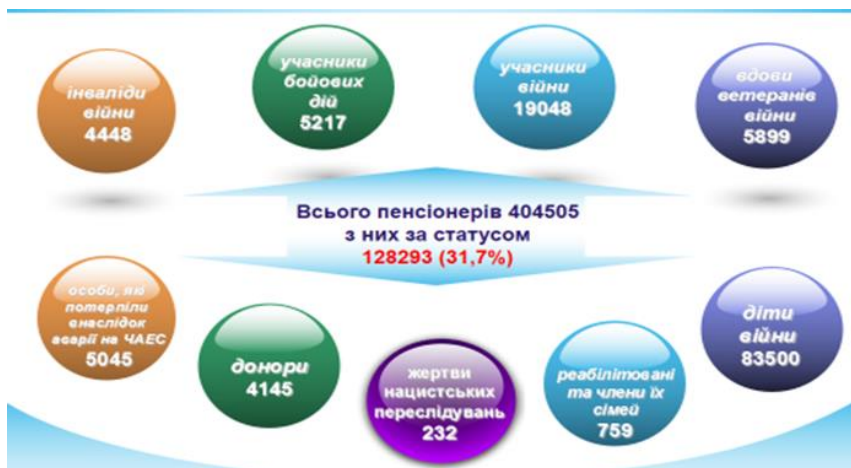
Рис. 2. Розподіл пенсіонерів, а саме соціально-вразливих категорій населення області за станом 01. 11 2018 р.

В Указі Президента України №99/2019 від 3 квітня „ Про відзначення у 2019 році Дня пам'яті та примирення, Дня перемоги над нацизмом у Другій світовій війні та 75-ї річниці вигнання нацистів з України ” визначено здійснення заходів щодо поліпшення умов життєзабезпечення ветеранів війни, насамперед інвалідів війни, учасників бойових дій, сімей загиблих у Другій світовій війні.